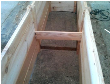
5) Die zwei Spreizen in der Mitte verschr. 5*50 Schr. 8mal