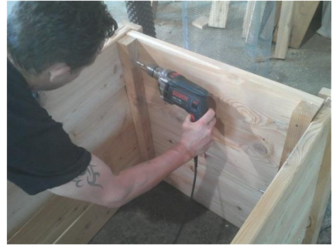
4) Zweite Stirnteil verschr. Von innen Auf jeder Seite mit 5*70 Schr. 3mal