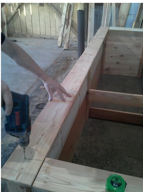
7) Handlauf für den Seitenteil je Stk 4mal verschr. 5*50 Handlauf für den Stirnteil je Stk 3mal verschr. 5*50