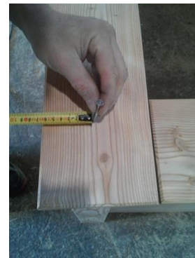
6) Den Handlauf von der Aussen- kante des Hochbeets 55mm Einmessen.